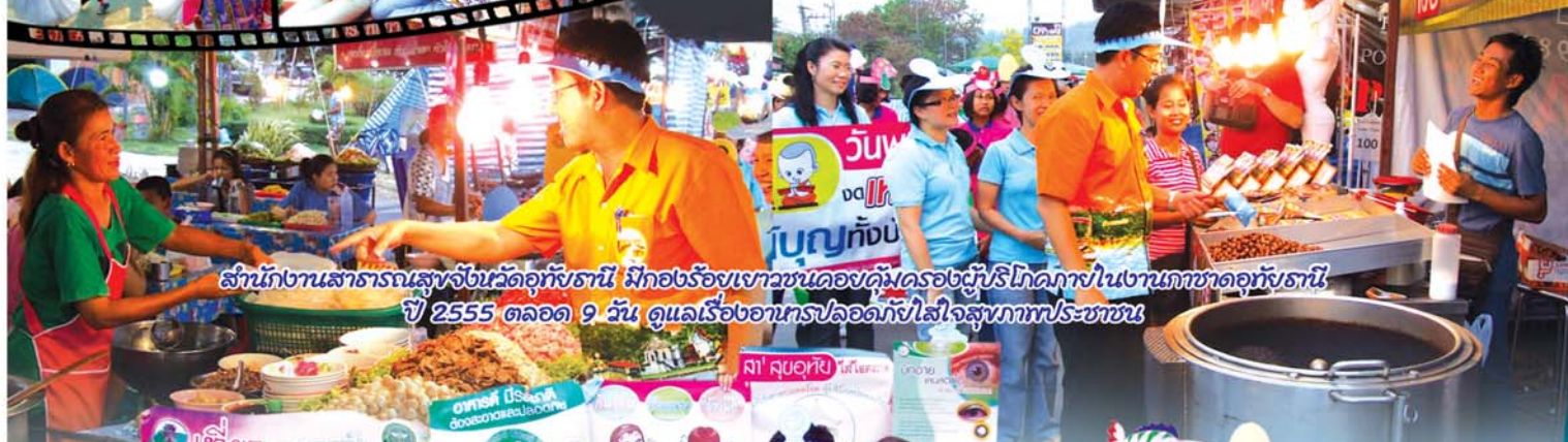
สำนักงานสาธารณสุขจังหวัดอุทัยธานี มีกองร้องเงาชวนดอกไม้เครื่องประดับวิถีโคกภายในงานกาชาดอุทัยธานี ปี 2555 ตลอด 9 วัน ดูแลเรื่องอาหารปลอดภัยใส่ใจสุขภาพประชาชน