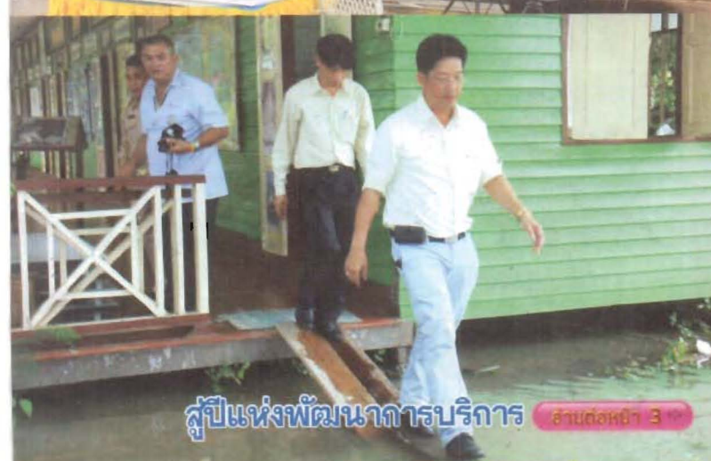
สุปั๊แห่งพัฒนาการบริการ อ่านต่อหน้า 3