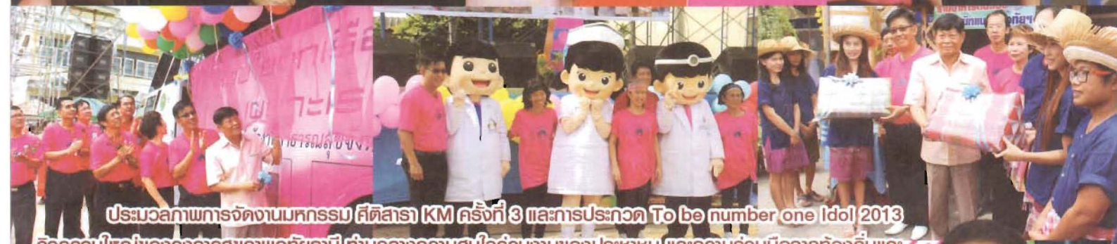
ประมวลภาพการจัดงานมหกรรม ศีตลารา KM ครั้งที่ 3 และการประกวด To be number one Idol 2013 กิจกรรมใหญ่ของวงการสุขภาพอุษธานี ท่ามกลางความสนใจร่วมงานของประชาชน และความร่วมมือจากท้องถิ่นและ ภาคีสุขภาพอื่นๆ ที่ช่วยนำพาการจัดงานไปสู่จุดประสงค์ แล้วพบกันอีกครั้งต่อไป