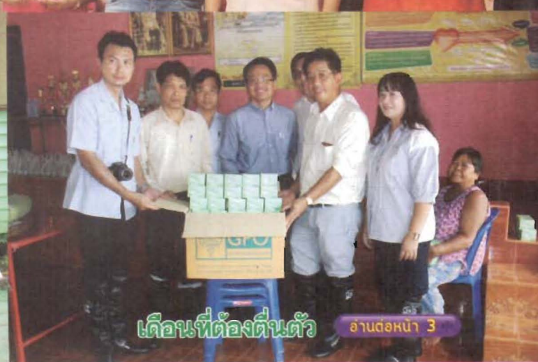
เดือนที่ต้องตื่นตัว อ่านต่อหน้า 3