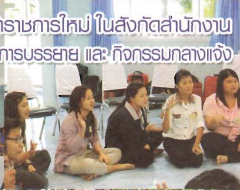
ประมวลภาพ การอบรมเตรียมความพร้อมข้าราชการใหม่ ในสังกัดสำนักงานสาธารณสุขจังหวัดอุทัยธานี ปี 2556 ในบรรยากาศการบรรยาย และ กิจกรรมกลางแจ้ง