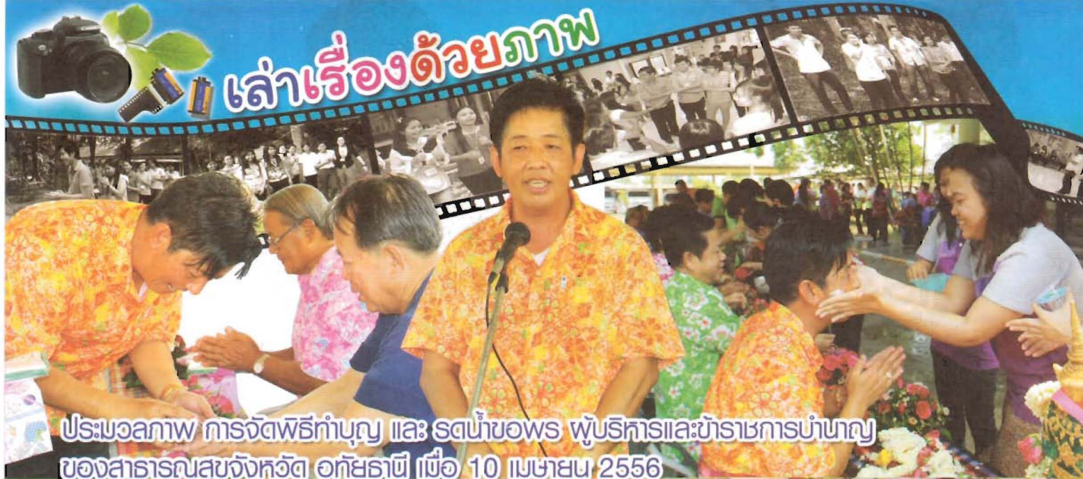
ประมวลภาพ การจัดพิธีทำบุญ และ รดน้ำขอมพร พุทธนิทานและข้าราชการบำนาญ ของสาธารณสุขจังหวัด อุทัยธานี เมื่อวันที่ 10 เมษายน 2556