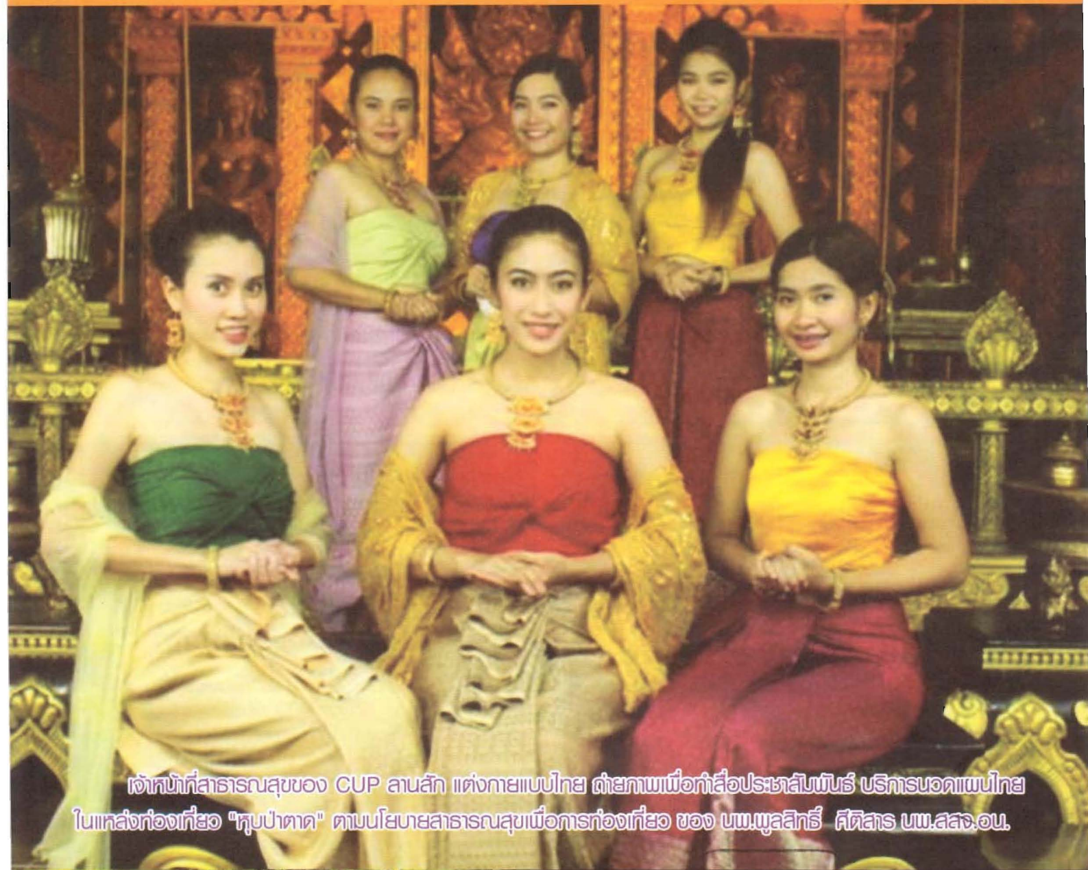
เจ้าหน้าที่สารานุกรมสุขของ CUP ลานสัก แต่งกายแบบไทย ถ่ายภาพเพื่อทำสื่อประชาสัมพันธ์ บริการนวดแผนไทย ในแหล่งท่องเที่ยว "หุบป่าตาด" ตามนโยบายสารานุกรมสุขเมื่อการท่องเที่ยว ของ นพ.วุฒิสถิ์ ศีตีสาร นพ.สสจ.อน.