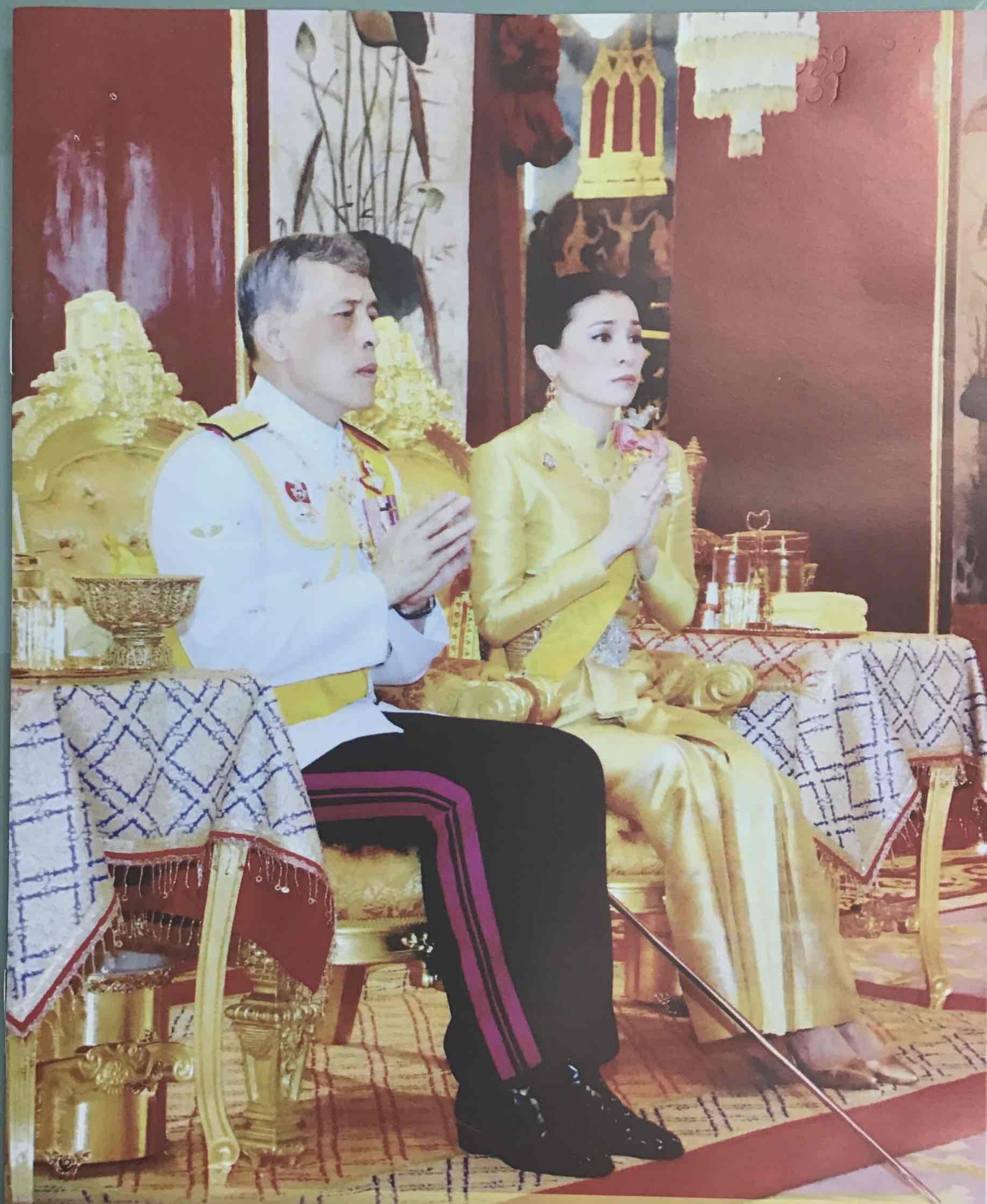
ชุมชนคุณธรรมนำการพัฒนา เทิดทูนสถาบันชาติ ศาสนา พระมหากษัตริย์