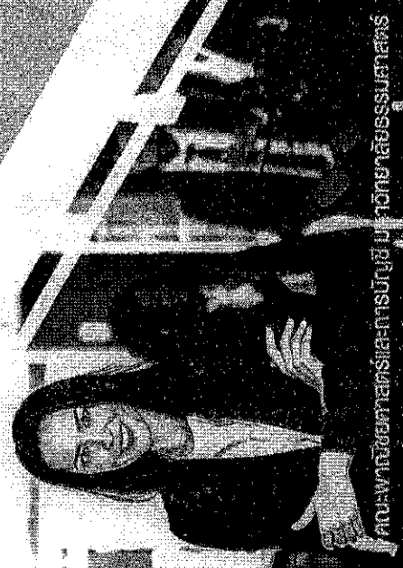
คณะผู้บริหารและบุคลากรของมหาวิทยาลัยธรรมศาสตร์

Advance HR - Survival Beyond Tomorrow 17 กุมภาพันธ์ - 26 พฤษภาคม 2561