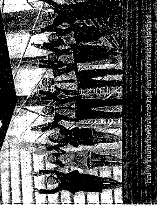
คณะผู้บริหารและคณาจารย์วิทยาลัยการศึกษาด้านบริหารธุรกิจ

Thammasat Consulting Networking and Coaching center, Thammasat Business School, Thammasat University 2 Prachan Road, Prachakorn, Bangkok 10200 Thailand Tel : +662 613 2247, +662 613 2258, +662 224 9734, +662 225 4507-8 Fax : +662 224 9735, +662 623 5653 E-mail : conc@tbs.tu.ac.th www.conc.tbs.tu.ac.th