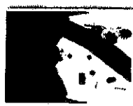
นายศิษย์ สิริภากราส อดีตรองผู้อำนวยการศูนย์