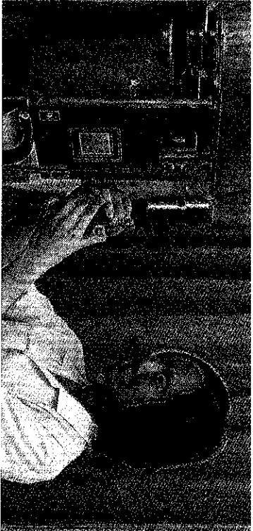
นักศึกษาแพทย์ที่มหาวิทยาลัยเทคโนโลยีพระจอมเกล้าธนบุรี

ความก้าวหน้าหลังสำเร็จการศึกษา มีความรู้ ความสามารถและทักษะในการวิจัยและพัฒนาด้านเภสัชกรรมและระบบสุขภาพ หรือด้านวิทยาศาสตร์ทางเภสัชกรรมที่สามารถปฏิบัติงานร่วมกับบุคลากรในองค์กรสุขภาพอย่างมีประสิทธิภาพ