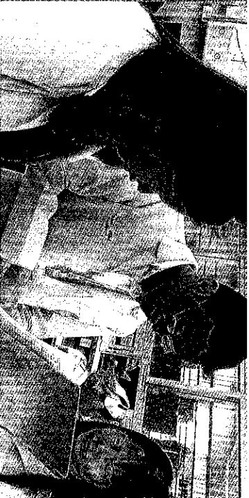
นักศึกษาเภสัชกรรมที่มหาวิทยาลัยเทคโนโลยีพระจอมเกล้าธนบุรี