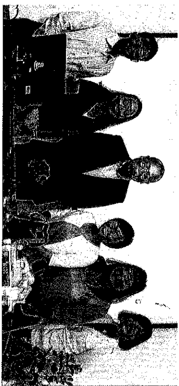
ห้องเรียนของบัณฑิตวิทยาลัย มหาวิทยาลัยเทคโนโลยีพระจอมเกล้าธนบุรี