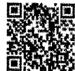
QR Code ลงทะเบียนออนไลน์