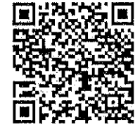
ส่งผลงาน