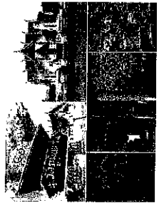
วันบูมบาร์(กรณีรถกับเลือโลก)

16.00- 18.00 น. สัมผัสความงามและธรรมชาติของจังหวัดน่าน 18.00- 22.00 น. งานเลี้ยงรับรอง “-คืนดินครน่าน”