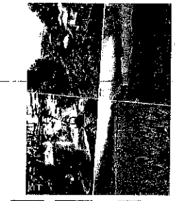
บ่อเกลือ