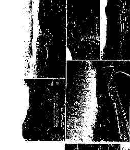
อุทยานแห่งชาติออบขยัค