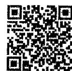
QR Code ลงทะเบียนออนไลน์