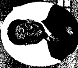
ดร.ปิยะ ภูมิภรณ์ กรรมการผู้จัดการ บริษัท ศูนย์บริการความรู้ทางเทคโนโลยีแห่งชาติ